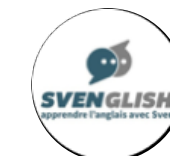
Svenshish Prestataire extérieur anglais